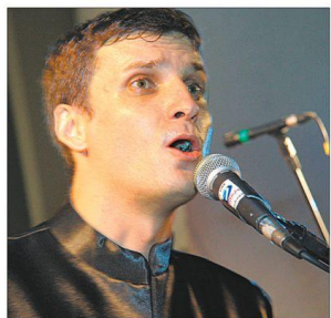
Em uma das suas apresentações no Estado: muito solicitado